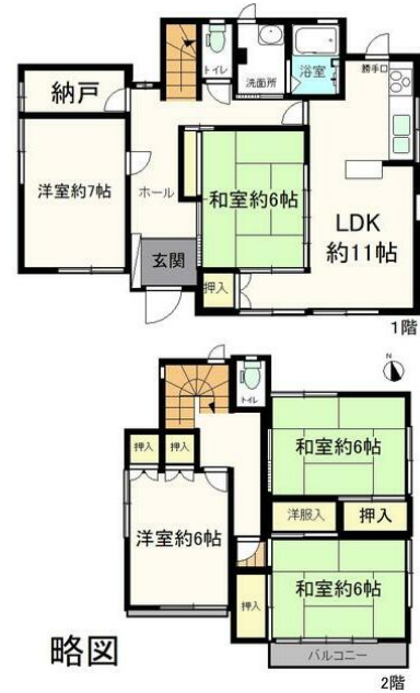
略図 間取図 (平面図)